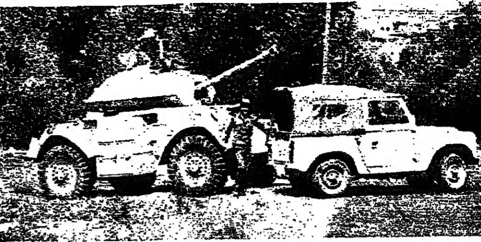
صفحة وسيارة جيب في اصدراواتك بالشمال